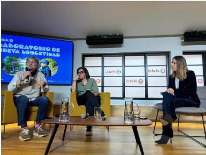
Presentación del primer Laboratorio de Longevidad de Bizkaia - BBK