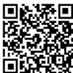
Texto de Cecilia Schulten (Neuquén)